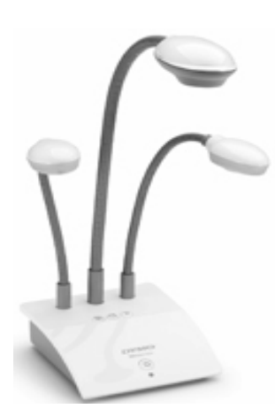
Şəkil 3. MimioView sənəd kamerası

Mimio İnteraktiv Proyektor - təhsil prosesi üçün hazırlanmışdır. Bu proyektorların fokuslama sahəsi bir qədər böyükdür və lövhənin üzərindən divara birləşdirilir. Belə quraşdırıldıqda, lövhədə işləyərkən kölgənin lövhəyə düşməsi ehtimalı azalır. Bu lövhələrin üzərində iki elektron qələm vardır (şək.1).