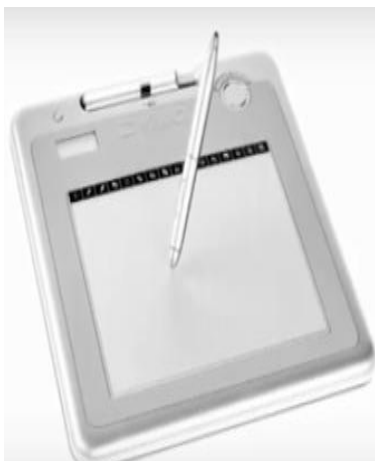
Şəkil 5. MimioPad simsiz planşeti