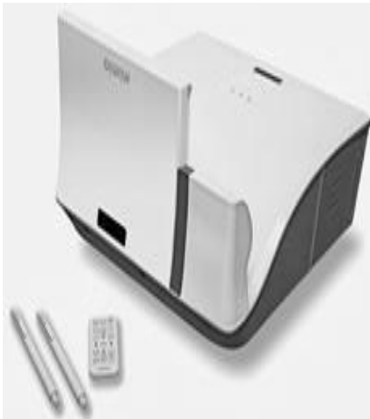
Şəkil 1. Mimio İnteraktiv Proyektor

Mimio interaktiv vasitələrinin təhsil prosesinə tətbiqi 2010-cu ildən DYMO/Mimio amerika kompaniyası tərəfindən həyata keçirilməyə başlanılmışdır.