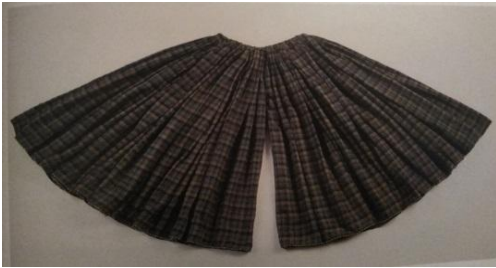
Şəkil 4. Cüt balaq. (Mountain Jews Customs and Daily Life in the Caucasus. The İsrail Museum. Jerusalem kitabına istinad edilmişdir)