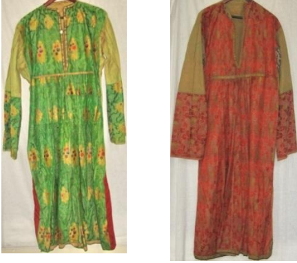
Şəkil 1. Dağ yəhudilərinə məxsus köynəklər (MATM EF inv.№6318; inv.№8522)

gümüş bafta ilə bəzədilirdi. Sonrakı dövrlərdə, bir çox xalqlarda olduğu kimi dağ yəhudiləri də dövrün tələblərinə uyğun olaraq geyimlərdə yaranan yeni - müasir elementlərdən istifadə etməyə başlamışlar.