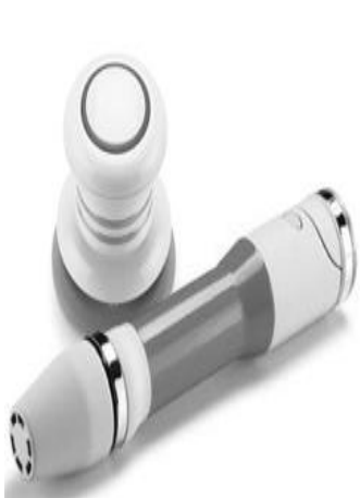
Şəkil 4. MimioCapture qeydetmə sistemi

MimioView qurğusu mətn, şəkil və hərəkətdə olan obyektləri foto və video formatında çəkir. Daha sonra çəkilən təsviri elektron lövhəyə ötürür (şək.3). MimioView qurğusu əsasən təhsil prosesi üçün nəzərdə tutulub. Bu qurğu istifadə edən şəxsə kiçik həcmli obyektlərin böyüdülmüş şəkildə təsvirini elektron lövhədə əks etdirmək üçün lazımdır. MimioView qurğusu MimioTeach qurğusu ilə MimioStudio proqram təminatını dəstəkləyir və kompüterə USB kabeli ilə birləşdirilir. MimioView qurğusunu quraşdırmaq üçün 2M Micron kamerası, mikroskop adaptoru, 2 ədəd LED işıq mənbəyi, burulma ilə tənzimlənən saxlayıcı, “micro-B” USB kabeli (3 m uzunluğunda), MimioStudio proqram təminatı lazımdır.