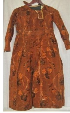
Şəkil 3, b. Bulşey (don) (MATM EF inv.№4385)