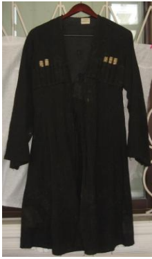
Şəkil 3, a. Çuxa MATM inv.№3944