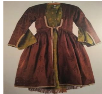
Şəkil 5. Altda “bulşey” adlanan don, üstündə isə qaba. (Mountain Jews Customs and Daily Life in the Caucasus. The İsrail Museum. Jerusalem kitabına istinad edilmişdir)