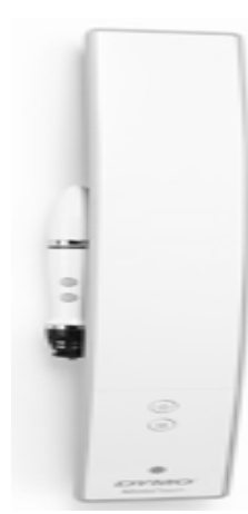
Şəkil 2. MimioTeach interaktiv sistemi