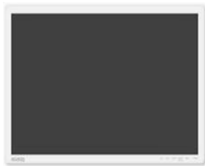
Şəkil 8. MimioDisplay LED

MimioDisplay LED də interaktiv lövhədir. Bu lövhə də toxunma funksiyasını dəstəkləyir. (şək. 8). MimioDisplay LED lövhəsi digər qeyd etdiyimiz lövhələrdən fərqli olaraq tədris prosesini daha interaktiv edir və şagird, tələbələrlə birgə işləmək imkanı verir.