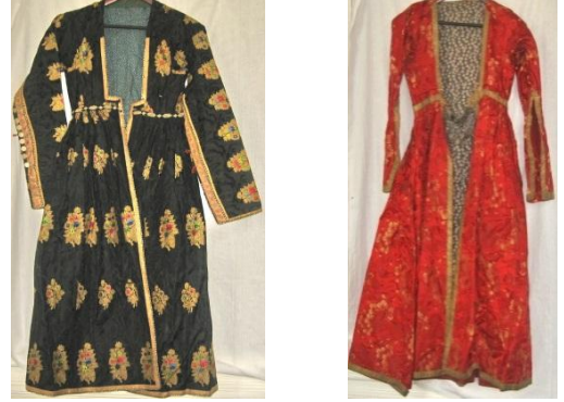
Şəkil 2. Qaba və ya koba adlı geyimlər (arxalıq) (MATM EF inv.№5958; inv.№6317)