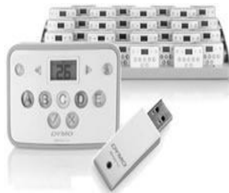
Şəkil 6. MimioVote qiymətləndirmə sistemi

MimioCapture qeydetmə qurğusu MimioTeach qurğusuna qoşulduqda lövhədə yazılanları cari anda qeyd edərək yaddaşda saxlayır (şək. 4). Elektron lövhədəki yazılar MimioCapture markeri ilə üzərindən seçilmiş rənglə çəkilməklə qeyd olunur və o dəqiqə istəkdən asılı olaraq zəruri fayl formatında saxlanılır. Bu qurğunun köməyi ilə əlyazma şrifti çap hərflə şriftə çevirmək olar. Bu qurğunun əsas xüsusiyyətlərindən biri MimioCapture qeydetmə rejimi və MimioTeach interaktiv rejimi arasında dinamik dəyişmə imkanının mövcudluğudur. MimioCapture qurğusunun işini MimioStudio proqram təminatı həyata keçirir. Belə ki, proqram vasitəsi ilə qurğu qeydetmə rejimində ağ lövhədəki obyektləri vektor formatında (*.ink) yaddaşda saxlayır. *.ink formatı qeydə alınmış səhifələrin və səhifə içərisindəki obyektlərin emalını, yəni redaktəsinə və yerdəyişməsinə şərait yaradır. MimioCapture elektron markerini quraşdırmaq üçün MimioCapture qurğusu, 4 ədəd marker saxlayıcısı, 4 quru silgili marker (qırmızı, yaşıl, göy, qara rənglərində), litium-ion batareyalı silgi, kabeli panel ( MimioTeach panelinə bağlantı üçün) lazımdır.